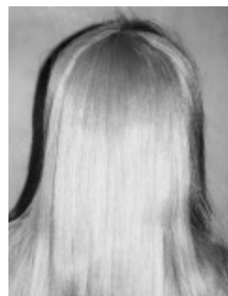
Frau G. aus D. (21)

Ich glaube das alles gar nicht, was ich in den Zeitungen sehe. Aber wenn ich mir einen aussuchen dürfte, würde ich schon Effe nehmen, weil der so schön offen ist.