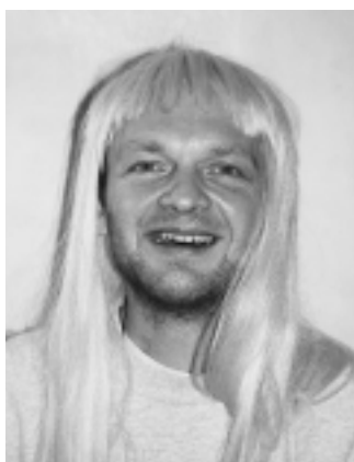
HERR W. aus D. (36)

Find ich ganz toll, wie der Effe und der Strunz das für sich hingekriegt haben. Da musst Du schon gut für drauf sein, so.