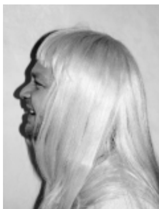
HERR U. aus ?. (18)

Ich meine meiner Meinung nach, dass die Frauen auch noch ein Wort zu reden haben sollten, bei der Partnerwahl. So einfach wie der Effe das meint, geht das ja nicht einfach so. Schließlich sind wir Frauen ja emotional stärker drauf als die Männer.